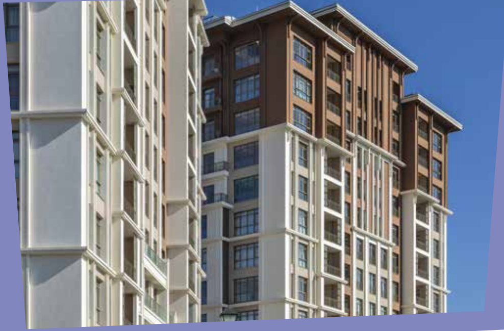
Referans Başakşehir Vadi (Altkat Architectural Photography)