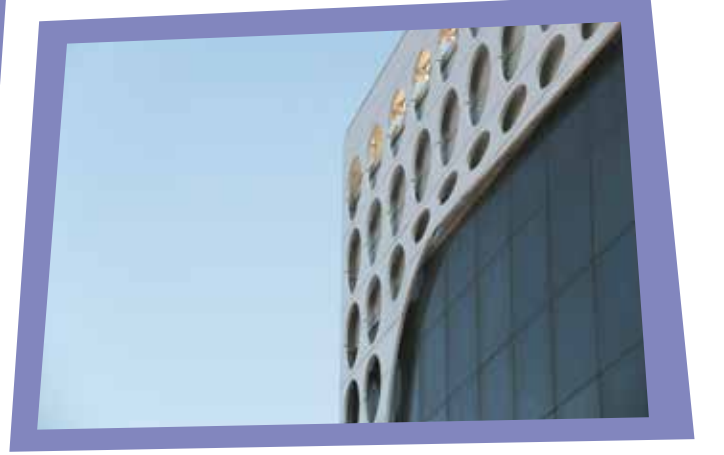
Çekmeköy Devlet Hastanesi